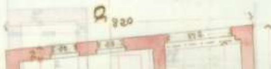
Původní vzhled domu na plánech z r. 1904.