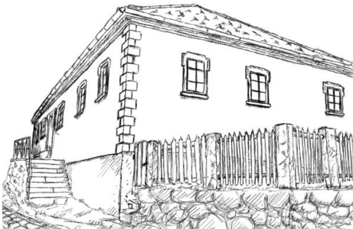
8) Skica možné rekonstrukce barokní podoby domu č.p. 78, pohled od jihu