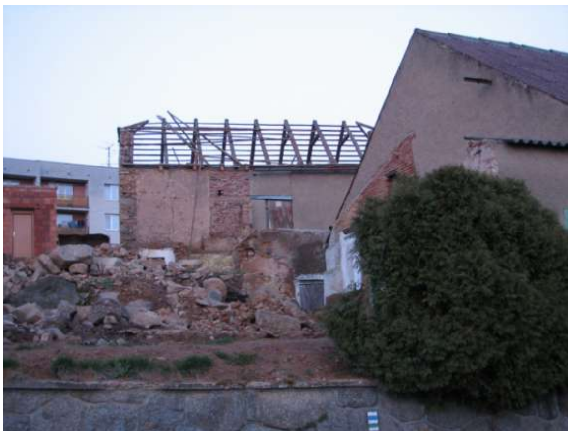
7) Stodola v průběhu demolice