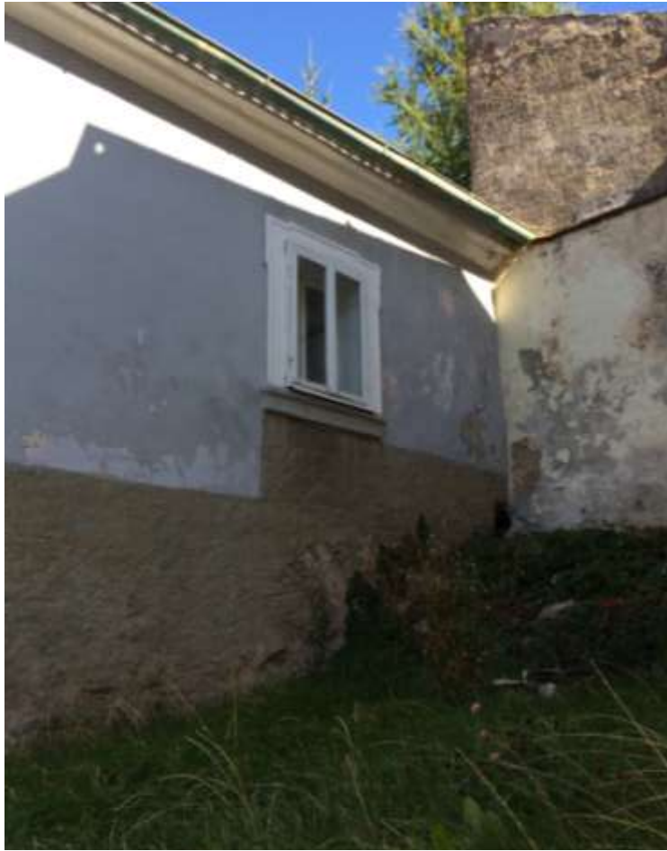
2) Barokní okénko a římsa na jižní fasádě