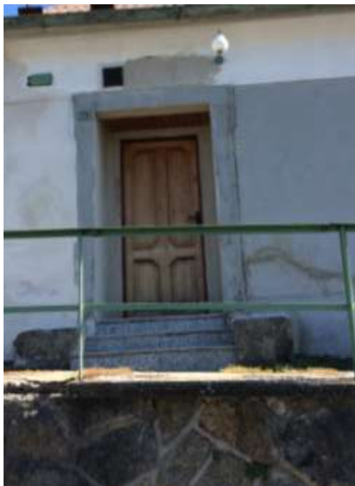
3) Barokní vstupní portál