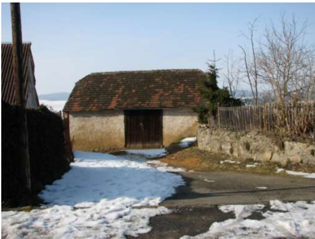
6) Stodola u č.p. 78 od východu r. 2006