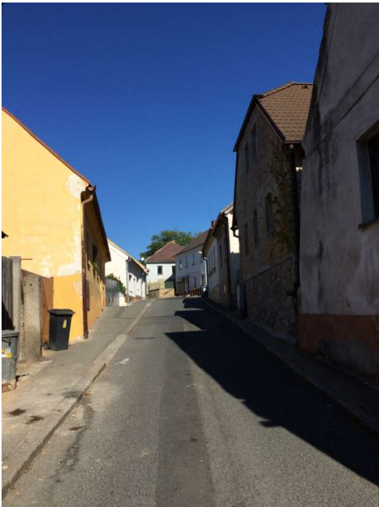
1) Průhled Zelenohorskou ulicí od náměstí