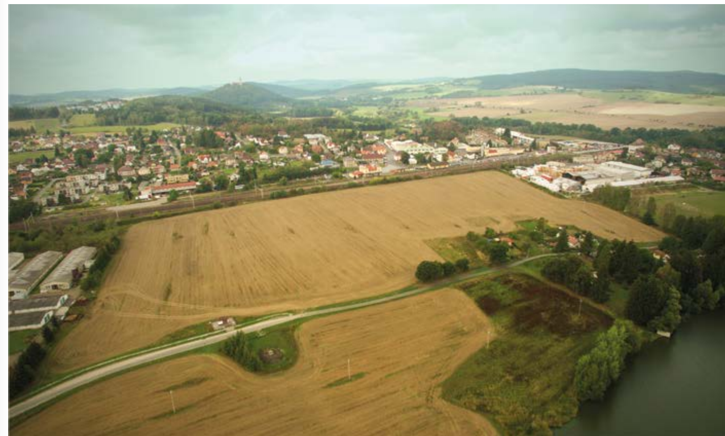
současný stav průmyslové zóny