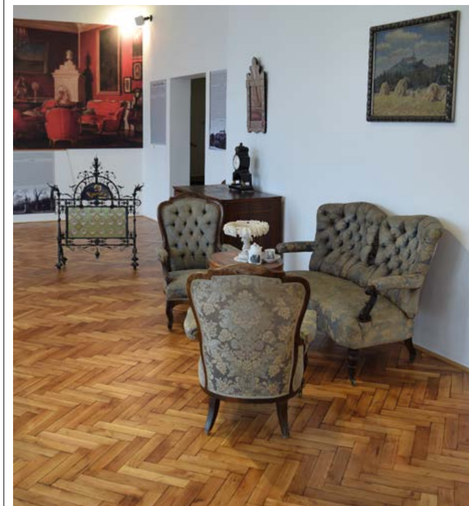
Část nové expozice o Zelené Hoře, foto Lukáš Mácha

Mapu míst si budou moci návštěvníci vyzvednout v den konání akce v informačním centru Nepomuk, případně v jednotlivých památkách. Vstupné do všech památkových objektů a místních muzeí je tento den zdarma. Plakát na akci je na zadní straně novin.