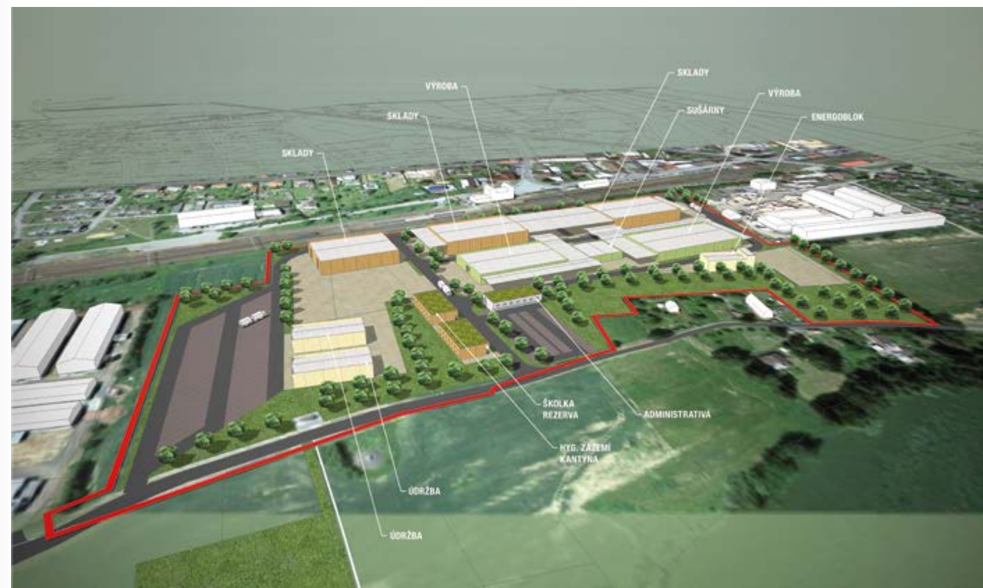
záměr společnosti KLAUS Timber a. s.