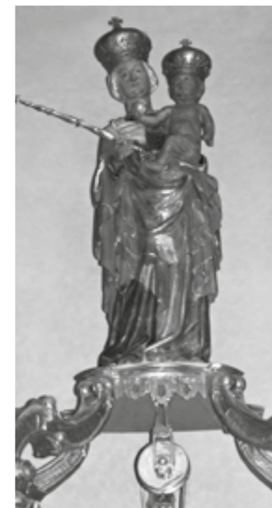
Socha Panny Marie Studniční, údajně pocházející z pomuckého kláštera.