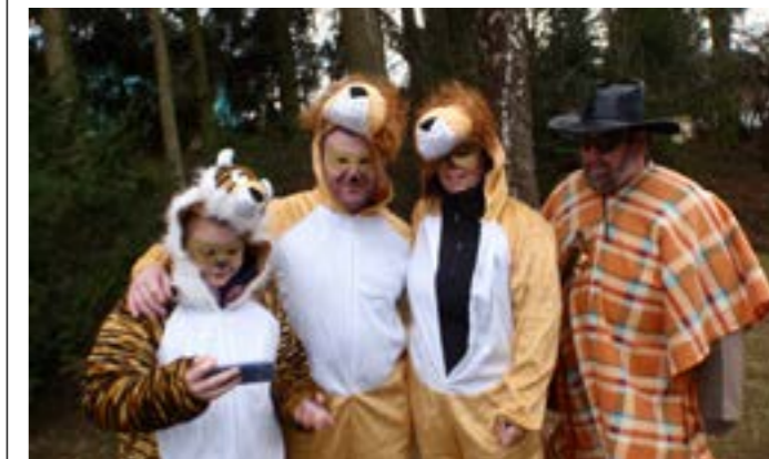
Masopust v Kozlovicích, foto archiv obce