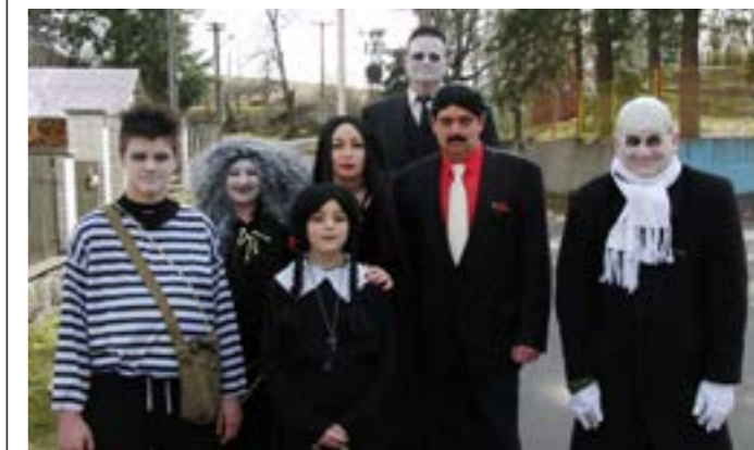
Masopust ve Vrčeni