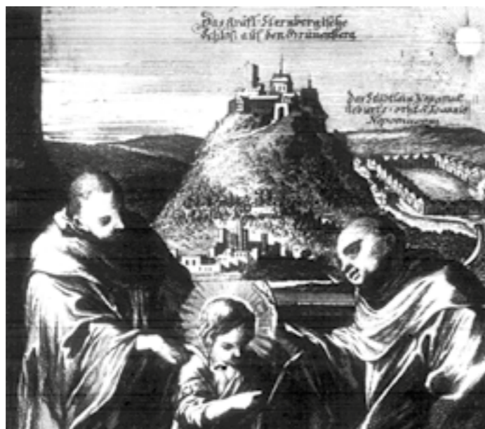
Zříceniny kláštera Pomuk, zámek Zelená Hora a město Nepomuk na pozadí barokní grafiky s Janem Nepomuckým v dětském věku, vychovávaným mnichy cisterciáky. Toto nejstarší známé vyobrazení kláštera bylo otiskováno v knize A. Sartoria Verreutsches Cistercium bis-tertium z roku 1708.

V letošním roce je tomu již 600 let od dobytí a vypálení Pomuckého kláštera, který byl v době své největší slávy jedním z nejvýznamnějších architektonických komplexů středověkých Čech. Cisterciácký klášter se rozkládal na území dnešní obce Klášter, která začala vznikat ve 2. polovině 16. století v místech bývalého kláštera a pozůstatky románského a gotických klášterních staveb jsou dodnes patrné po celé vsi.