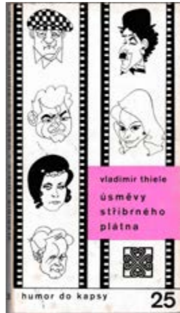
Obálka knihy s ilustracemi malíře