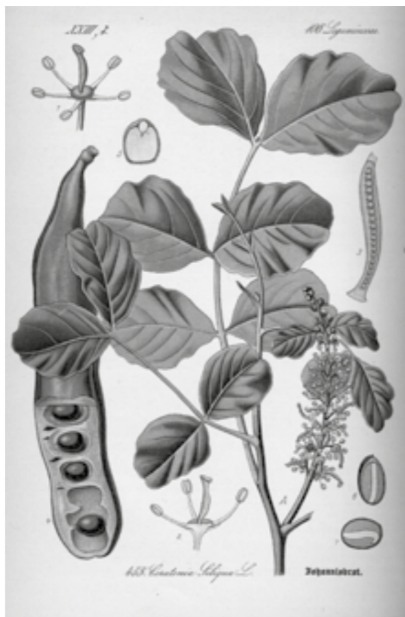
Rohovník obecný – karob – svatojánský chléb