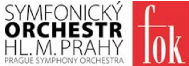
Dodnes používané logo FOK