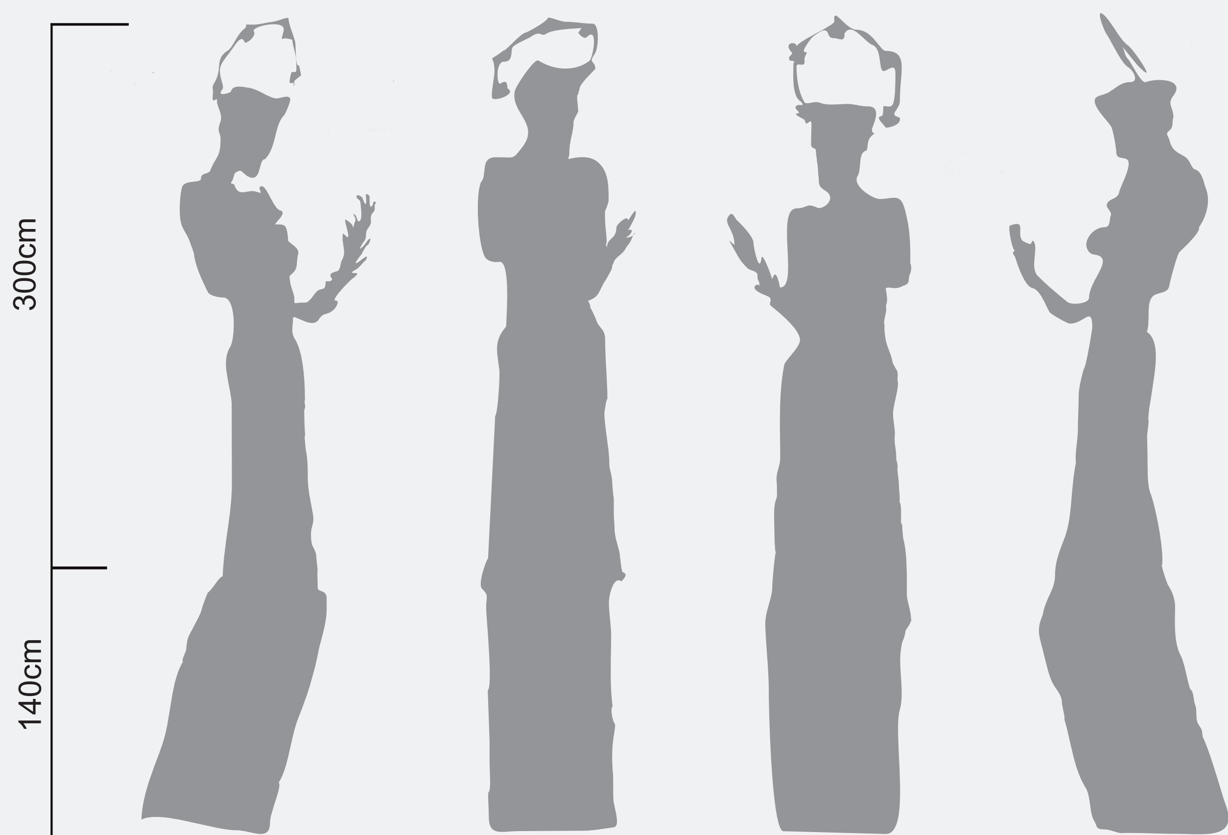
Zobrazení pohledů 1:20